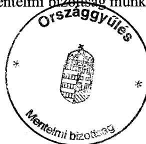
..... átvevő Mentelmi bizottság munkatársa